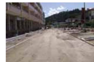
Rua Neuves Maisons