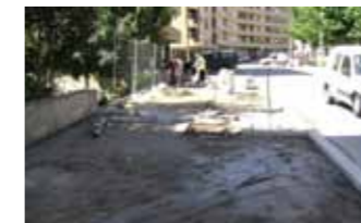
Rua Comandante Luís Pinto da Silva