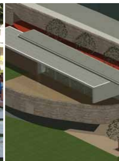
Projecto do Espaço Jovem