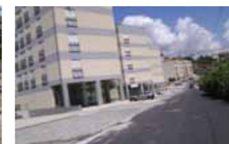
Rua Paixão Bastos