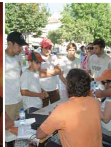
Festa da Juventude 2007