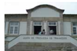
Junta de Freguesia de Travassos