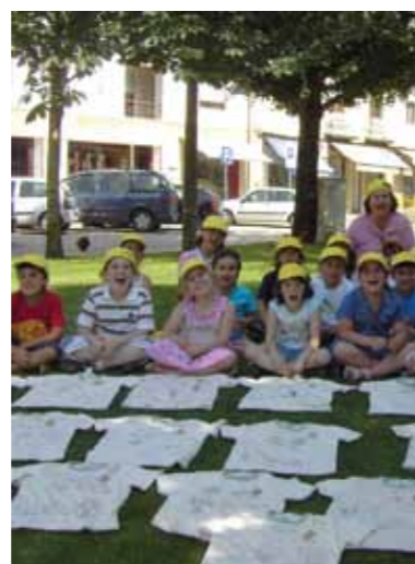
Semana do Ambiente e da Criança