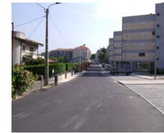
Rua Paixão Bastos