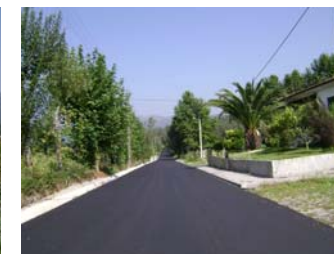
Estrada Monsul - Verim